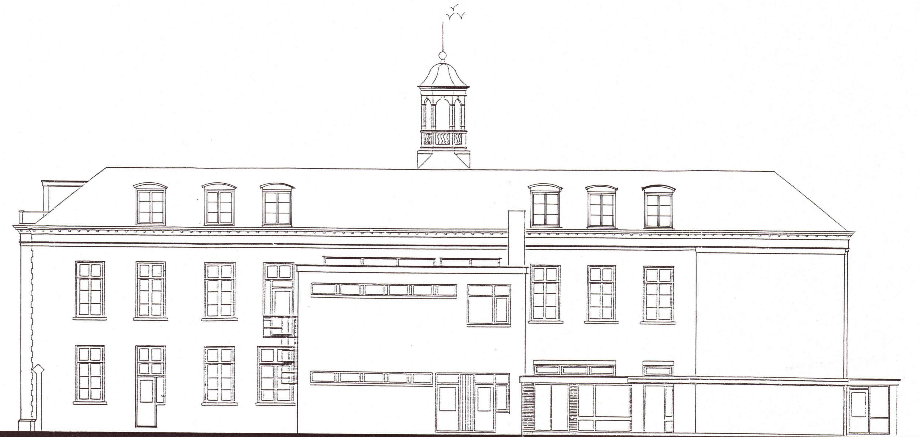
B ACHTERGEVEL (ZUID)