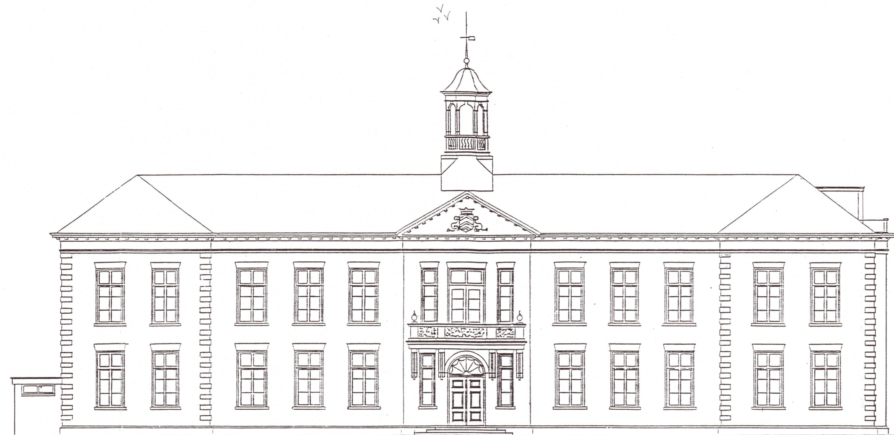
A VOORGEVEL (NOORD)