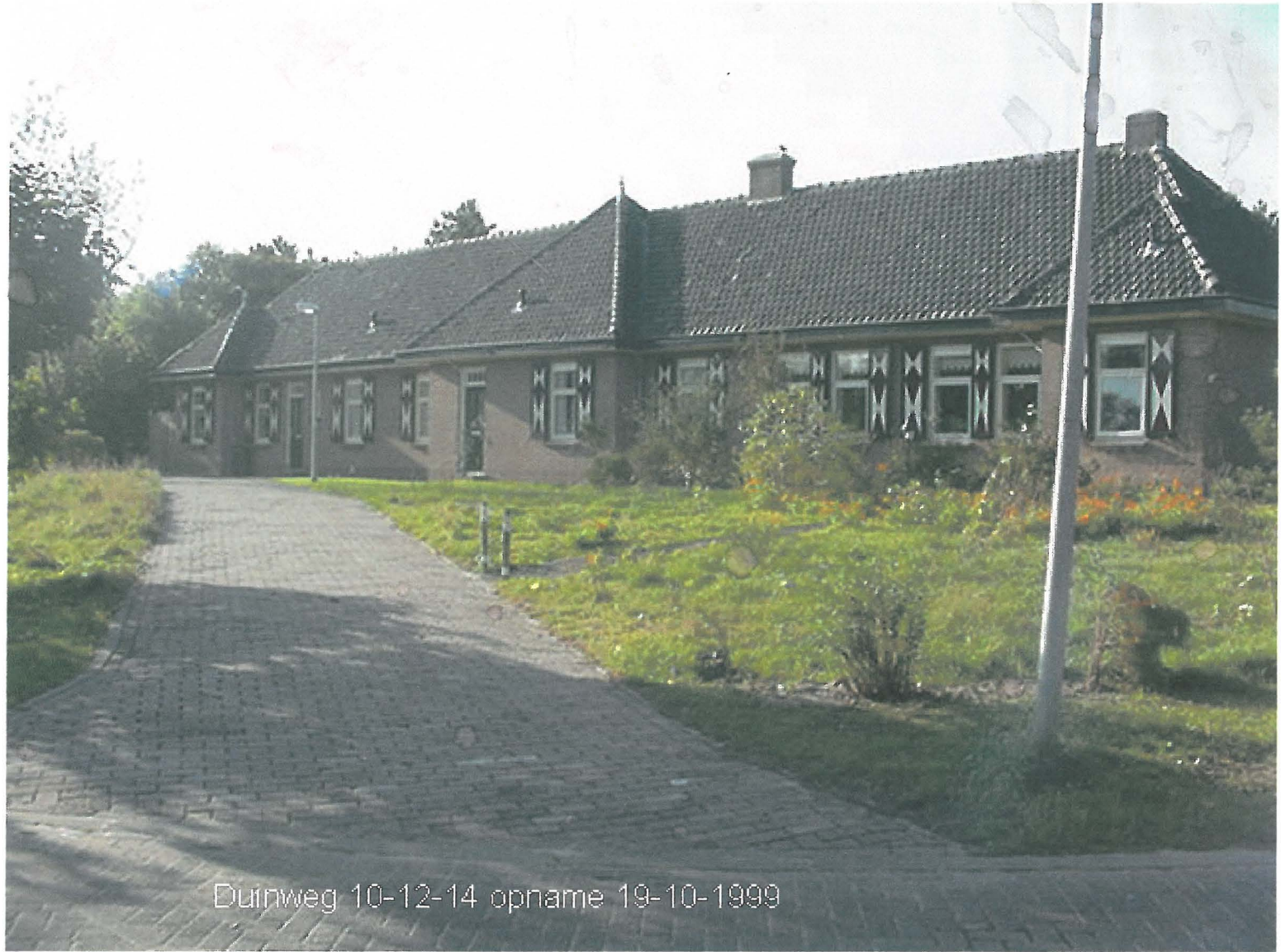
Duinweg 10-12-14 opname 19-10-1999