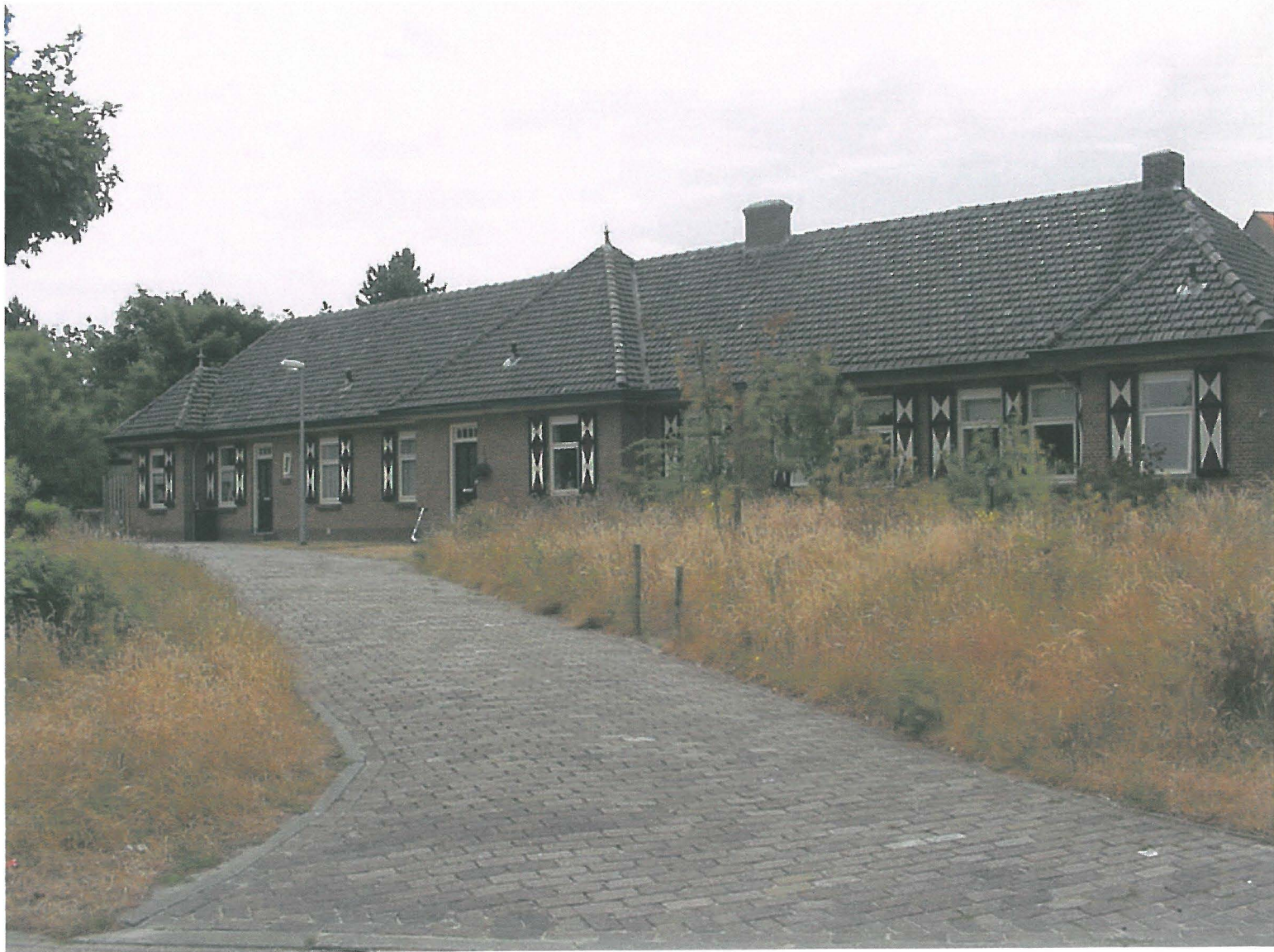
Duinweg 10-12-14 juli 2001