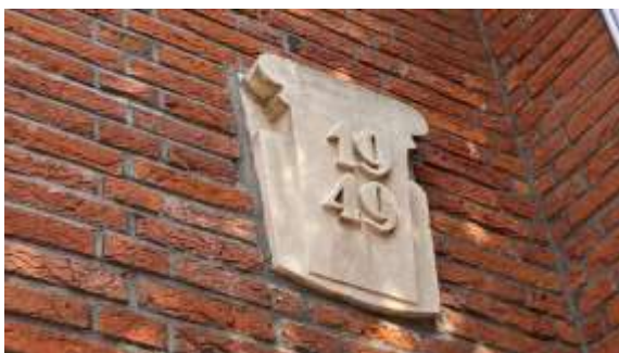
Afbeelding 5: Gevelsteen (2021)

Belangrijk accent aan deze gevel is het siermetselwerk boven de vensters van begane grond en verdieping, dat bestaat uit vierkant gemetselde blokvormen met twee staande stenen in het midden. Daarboven een eenvoudige balustrade voor het balkon.