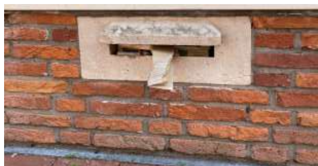
Afbeelding 6: Detail, brievenbus (2021)

De zijgevel is evenwichtig opgebouwd. In de top van de met een betonlijst afgedekte tuitgevel, is een smeedijzeren sieranker zichtbaar; tevens is er een klein rond sieranker links aan de zijgevel, tussen begane grond en verdieping. In het midden onder de top zit een hijsbal en dubbele openslaande verhuisramen.