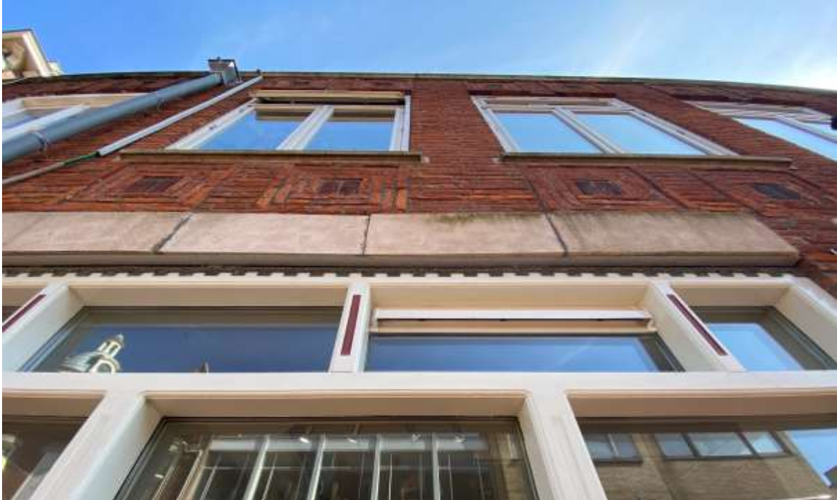
Afbeelding 4: Siermetselwerk en loodslabje met sierpatroon (2021)

De voorgevel van Spoorstraat 52 toont een drietal winkelpuien op de begane grond; alle bezitten een accent aan de bovenzijde door een brede betonlijst, waaronder een loodslabje met sierpatroon zichtbaar is. In de rechter pui bevindt zich een dubbele entree deur. De puien, alle samengesteld uit forse houten stijlen, bestaan uit grote vensters met aan de bovenzijde een rij van kleinere vensters. Tussen deze kleinere vensters is een opdikking van het hout. In het dak van de Spoorstraat 52 bevinden zich twee identieke dakkappellen.