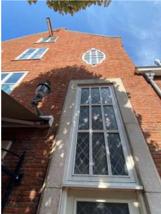
Afbeelding 7: Zijgevel (2021)