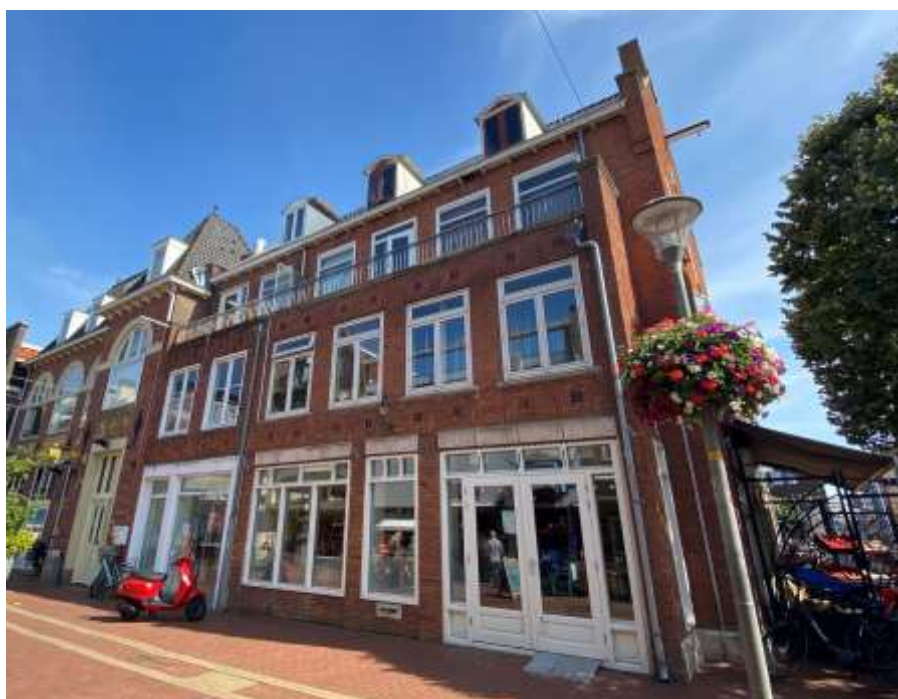
Afbeelding 2: Gevel aan de Spoorstraat (2021)