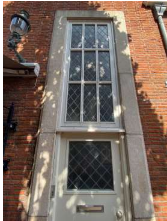
Afbeelding 8: Detail entreepartij (2021)