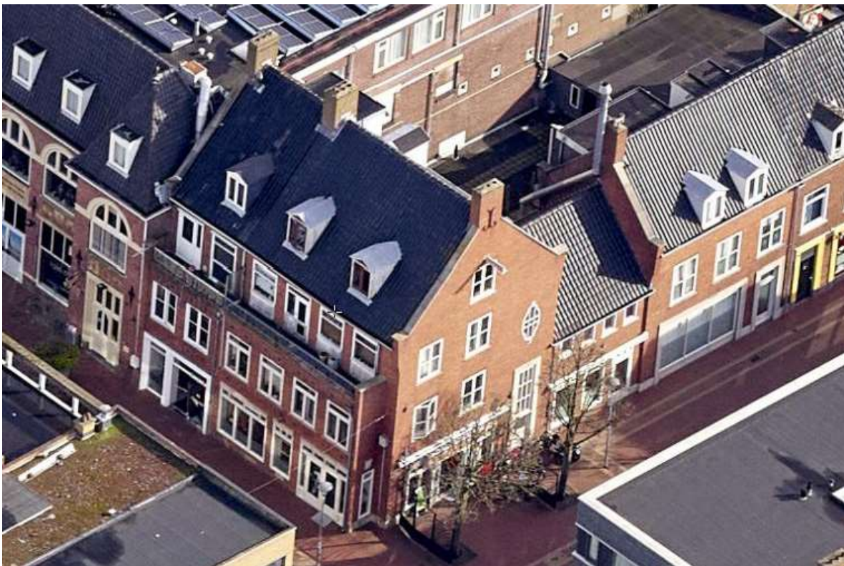
Afbeelding 9: Luchtfoto, indeling zij- en voorgevel

In de rechterzijgevel, geheel rechts op de begane grond bevindt zich de entreepartij, die bestaat uit een forse en hoge betonnen omlijsting met daarin de entreedeur met vierkant venster die is voorzien van glas met een rasterpatroon daarin. Boven de deur een hoog venster voorzien van een roedenindeling. De entree leidt via een trap en trappenhuis naar de woning(en) boven de winkels. Boven de entreepartij is een solitair, afwijkend vormgegeven