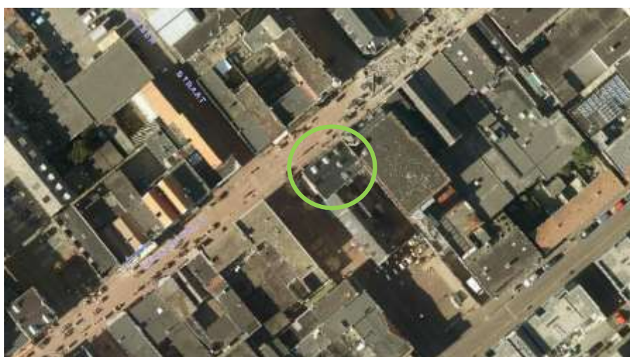
Afbeelding 1: Luchtfoto, ligging Spoorstraat 52 en 54