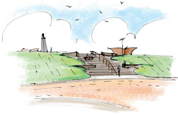
Afbeelding: Impressie van een aantrekkelijke dijkopgang op de kop van de Badhuisstraat