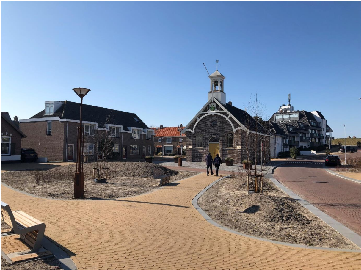
Afbeelding: Het Dorpsplein is heringericht als aantrekkelijk, groen en autoluw verblijfsgebied

We hebben de ambitie om de kwaliteit van het verblijfsgebied op het Dorpsplein, dat momenteel loopt tot aan de Zeeweg en de voet van de Helderse Zeewering, verder door te trekken tot aan Fort Kijkduin. Hierdoor wordt dit gebied, waar de toeristische en recreatieve activiteiten van Huisduinen zich concentreren, aantrekkelijker voor bezoekers en krijgt langzaam verkeer ook daar meer ruimte ten opzichte van de huidige situatie. De aanleg van een aantrekkelijke dijkopgang, in aansluiting op de recente herinrichting van het Dorpsplein, biedt ook een kwalitatieve impuls aan het gebied en maakt de relatie tussen de dijk en het Dorpsplein, als centrum van Huisduinen sterker. Hiermee ontstaat een aantrekkelijk gebied voor bewoners en bezoekers ontstaan, lopend van het Dorpsplein langs de dijk tot aan het Fort Kijkduin en het strand.