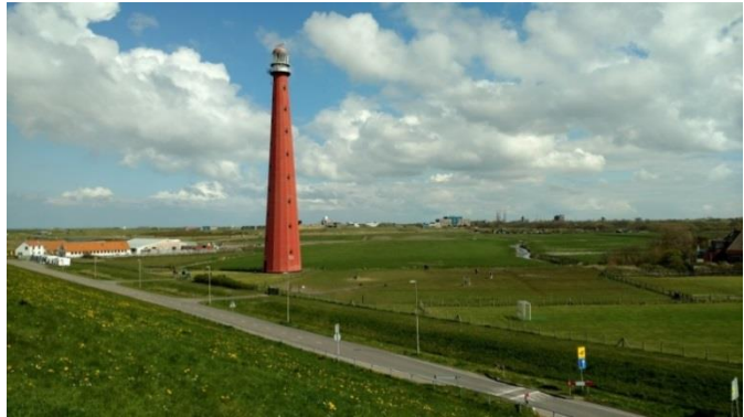
Afbeelding: De Huisduiner Polder en de iconische 'Lange Jaap'

Deze visie geeft een integrale ontwikkelrichting voor het dorp Huisduinen en haar natuurlijke omgeving en beschrijft de ambities om het dorp kleinschalig verder te laten ontwikkelen.