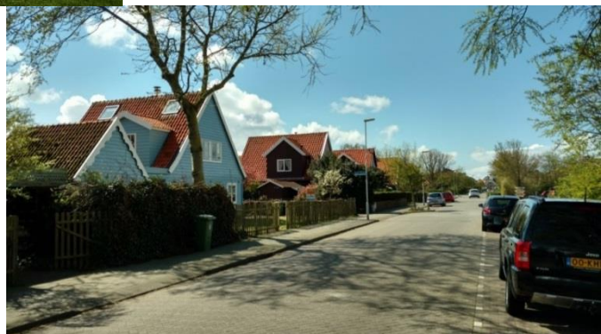
Afbeelding: Badhuisstraat met typische 'Oostenrijkse woningen'