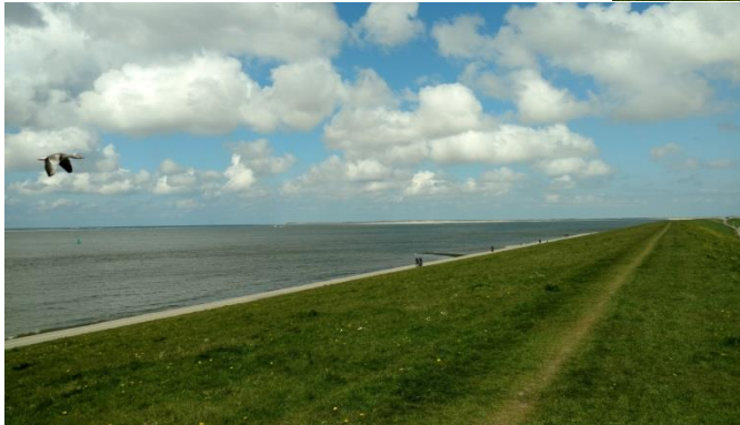
Afbeelding: Uitzicht over de zee en Texel vanaf de Helderse Zeedijk