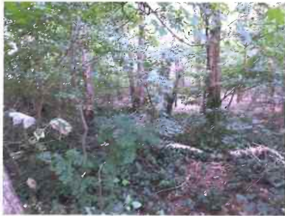
Voorbeeld van een open bos structuur.

Dit wil zeggen dat de beplanting zich dusdanig heeft ontwikkeld dat deze alleen nog bestaat uit hoge bomen en struiken met weinig kroon en blad oppervlakte. Er kan makkelijk door de beplanting heen gekeken worden.