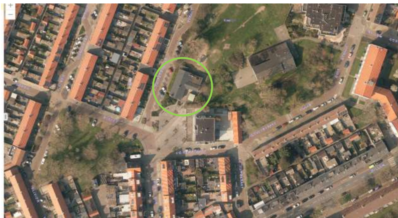
Afbeelding 1: Luchtfoto, ligging van het buurthuis

Architect: Directeur Openbare Werken van de Gemeente Den Helder