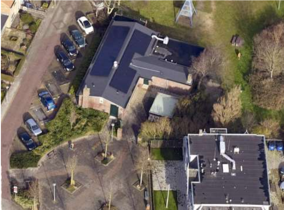
Afbeelding 6: Bovenaanzicht van het gebouw, zonnepanelen en latere uitbouwen zichtbaar

Vóór de aanwijzing van dit gebouw als gemeentelijk monument zijn er al zonnepanelen geplaatst op het dak van de grotere bouwmassa. In 1994 is er een berging gebouwd aan de achterzijde van het pand. In 2000 is er een fietsenstalling vergund, die losstaat. Deze latere toevoegingen vallen buiten de bescherming.