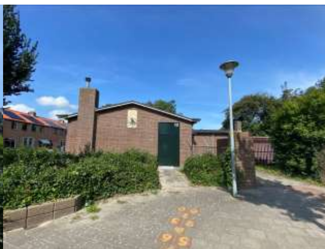
Afbeelding 3: Zijgevel Het Kraaiennest (2021)