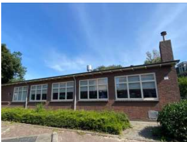
Afbeelding 2: Voorgevel Het Kraaiennest (2021)