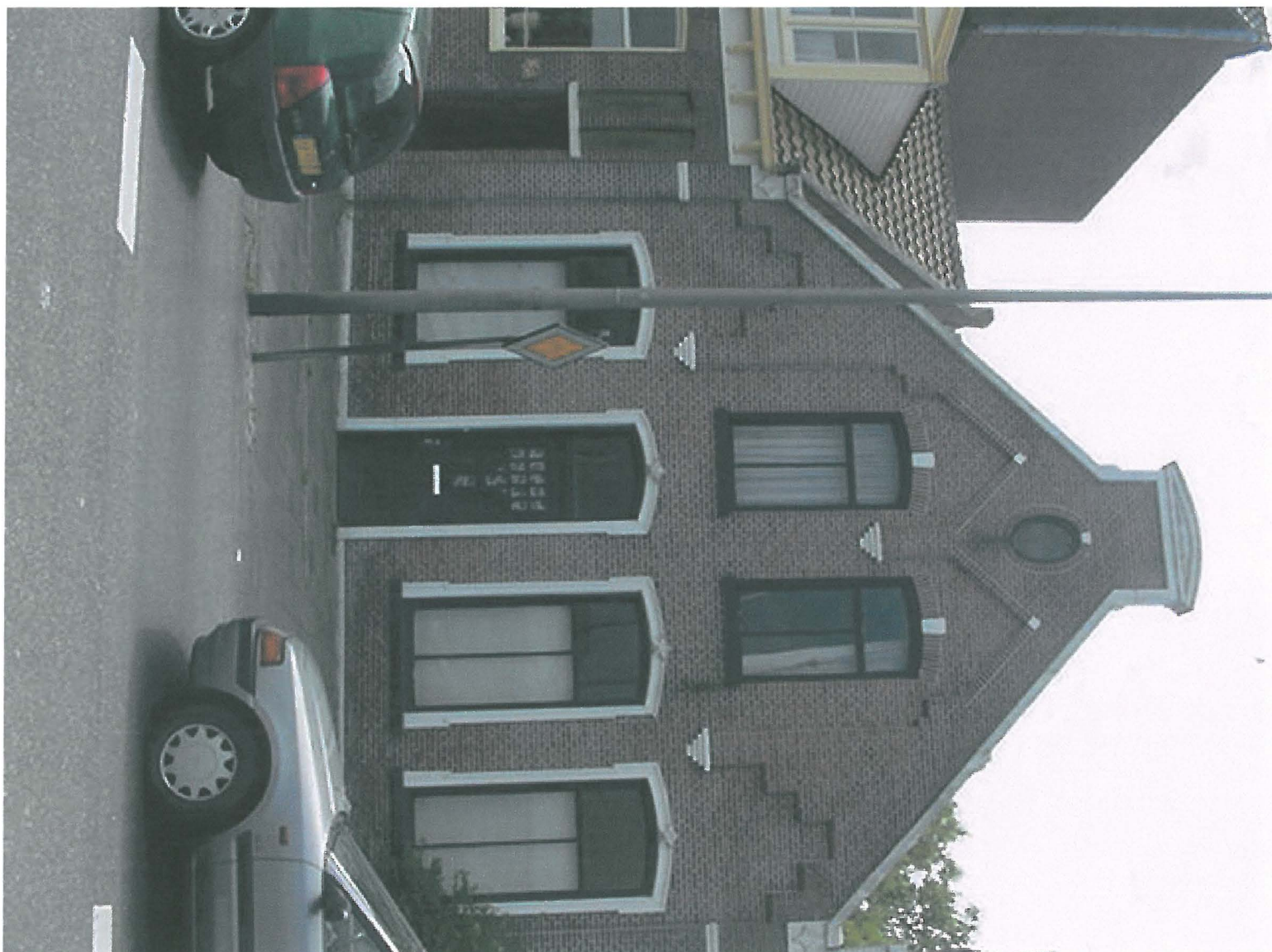
Binnenhaven 61 juni 2001