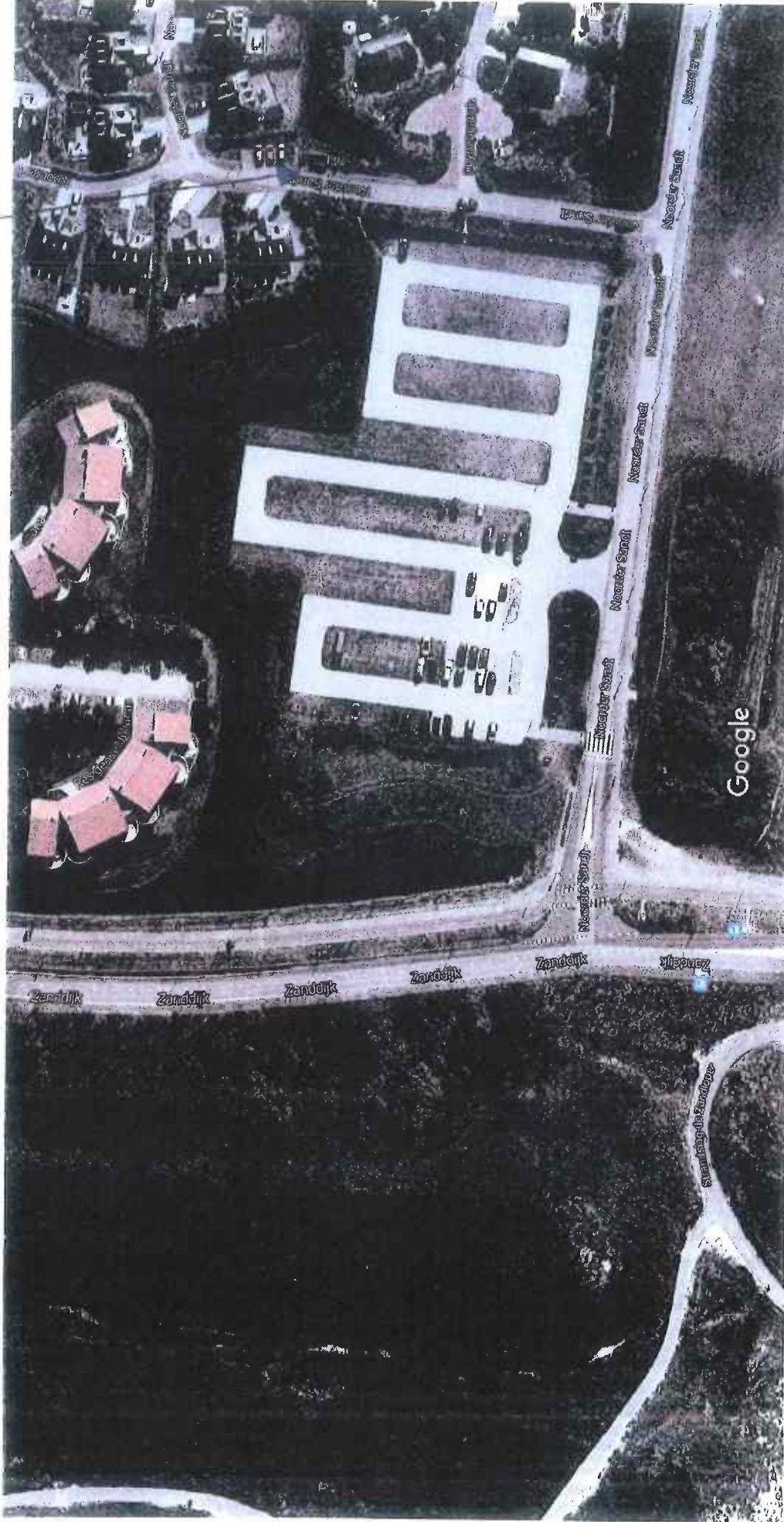
20 m

Google Maps Roompot Vakanties Resort Duynzicht