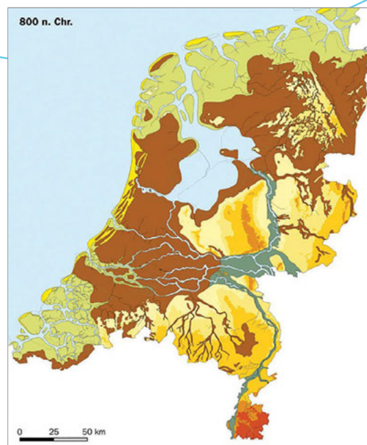
De structuur van Nederland en Noord-Holland rond 800 na Christus

Waar de naam Helder vandaan komt is niet helemaal duidelijk. Verwezen wordt wel naar helle of helde , wat helling of aflopend stuk land betekent, of Helre , wat een kleine zanderige rug betekent. Ook wordt wel eens gedacht dat de naam verwijst naar 'Helsdeur'. Voor vijandelijke schepen die de Zuiderzee op wilden varen, zou de ligging van dit zeegat een hel zijn geweest... Tijdens de Allerheiligenvloed van 1570 werden stukken duin weggeslagen en gingen de kernen van Huisduinen en Helder verloren. De dorpen werden verder landinwaarts opnieuw opgebouwd. Sinds het realiseren van de Zanddijk tussen Huisduinen en Callantsoog, in 1610, is het gebied verbonden met het vaste land.