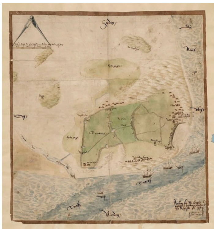
1577, zuiden is bovenaan getekend. De Heldere buyrt ligt onderaan, achter een duinenrij, Huisduinen (groter nog) zien we wat hoger rechts.