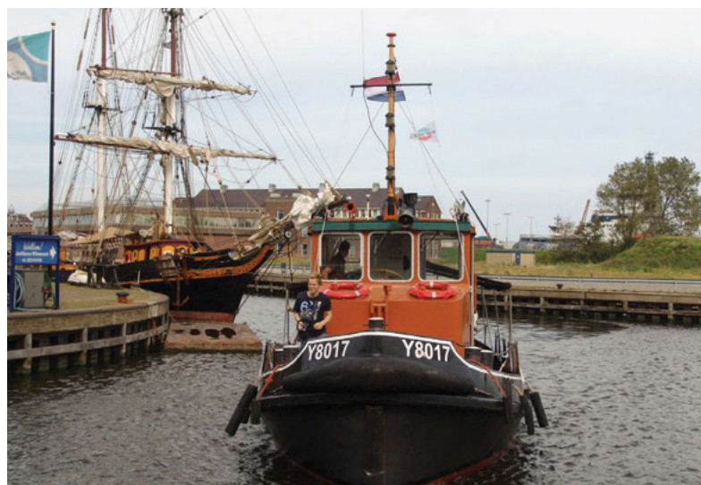
Motorsleper Y8017; op de achtergrond de schoenerbrik Tres Hombres, een professioneel zeilend vrachtschip waarmee wordt gepoogd de zeilende handelsvaart nieuw leven in te blazen.

Zonder het werkelijke varend materieel zou er geen scheepswerf, geen scheepvaart en geen marine bestaan. De (aanwezigheid van de) soms prachtige (oude) schepen in de havens en op de werven zijn bepalend voor het vertrouwde beeld in Den Helder. Het is belangrijk ook aan dit varend erfgoed aandacht te besteden.