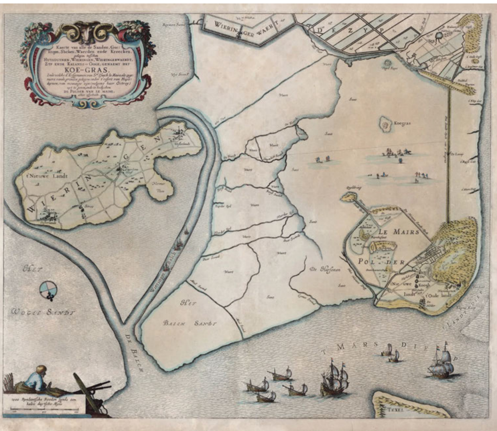
Rond 1640, Huisduinen is door middel van de Zanddijk met Callantsoog verbonden (Noorden onderaan kaart)

de aanleg van de Rijkswerf (1822), het Noord-Hollands kanaal (1824), de verschillende fortificaties, woonwijken rond de Rijkswerf, scholen en kerken en de uitbreiding van de haven (het Nieuwe Diep). Aan de westzijde van het Noord-Hollands kanaal werd in 1825 begonnen met de bouw van Fort Westoever. Om het Noord-Hollands kanaal te beschermen werd Fort Oostoever aangelegd op de plek van de kielplaats van Het Nieuwe Werk. Den Helder werd in 1844 opgenomen in de lijst van vestingsteden. De Kringenwet (1814, herzien in 1853) bepaalde dat rondom ieder verdedigingswerk kringen werden ingesteld van diverse afmetingen, en regelde het slopen, bouwen, rooien, beplanten en het wijzigen van de bestemming binnen deze 'Verboden Kringen'. Pas in 1963 is de wet definitief ingetrokken. De Stelling van Den Helder is nog steeds markant aanwezig in de stedelijke structuur van Den Helder.