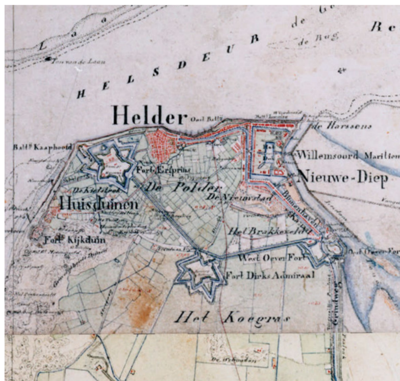
Het gebied rond 1850, de forten zijn door de linie verbonden

Om een weerwoord te kunnen bieden aan het dalende aantal inwoners is het nodig in te zetten op een diversere economie, als basis voor stedelijke voorzieningen. Het aantrekkelijk maken van de stad voor bedrijven, bewoners en bezoekers is belangrijk. Hierbij speelt een interessante omgeving, waarin de gelaagde geschiedenis beleefd kan worden een grote rol. Het belang van hergebruik en herontwikkeling van erfgoed wordt hierdoor onderstreept.