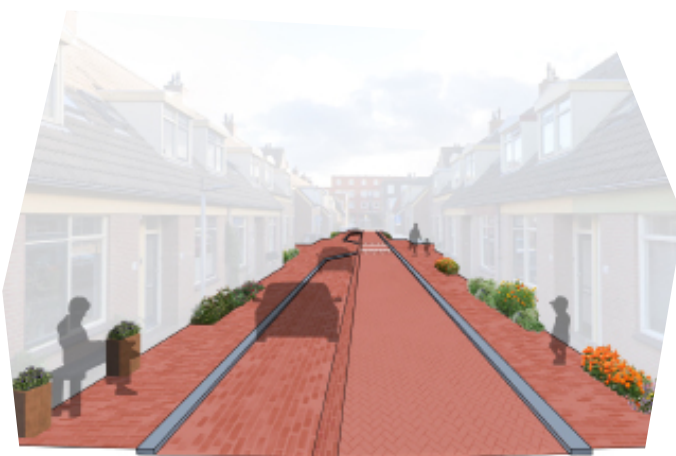
Impressie inrichting 1 ste Vroonstraat

In de Vlamingsstraat zijn raingardens te zien in het ontwerp van de straat. Raingardens zijn plantvakken die water kunnen opvangen. Groen in de stad kan een belangrijke rol spelen in klimaatadaptatie: groen werkt verkoelend, groen vermindert wateroverlast en groen voorkomt uitdroging van de bodem tijdens droge periodes én wateroverlast tijdens natte periodes. De raingardens zijn hier een voorbeeld van, maar ook u kunt hieraan bijdragen. Bijvoorbeeld door het aanvragen van een geveltuint of uw achtertuin te vergroenen.