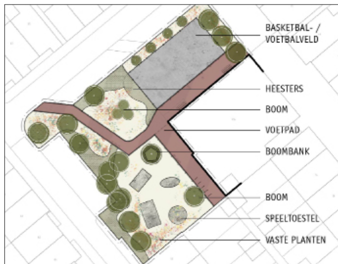
Ontwerp speeltuin Buurthuis Centrum