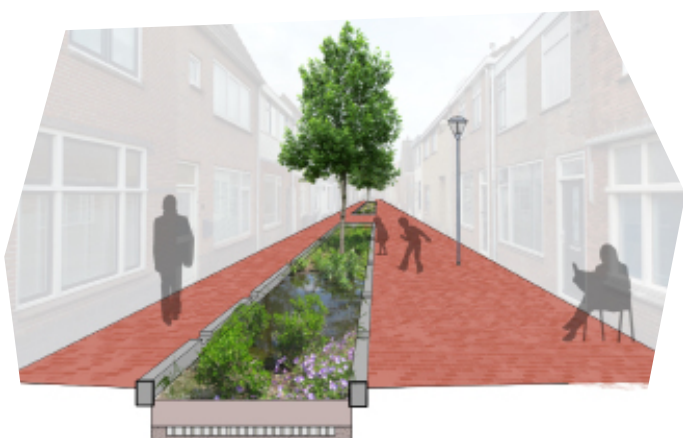
Impressie inrichting Vlamingsstraat

De tekeningen hieronder geven een indruk hoe de straten er uit kunnen komen te zien.