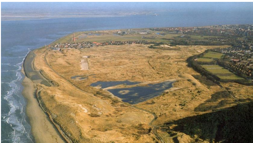
Afbeelding: luchtfoto met de scherpe grens tussen duin en wijk rechts in beeld.

Nieuw Den Helder heeft een unieke ligging met de duinen en het strand op een steenworp afstand. Als gevolg van de snelle, seriematige woningbouw uit de wederopbouw, met name gericht op het bereiken van kwantitatieve productie, is deze unieke ligging echter slechts weinig voelbaar in de wijk. In de oorspronkelijke architectuur en openbare ruimte komt het duinlandschap niet terug en een groot deel van de overgang van de wijk naar het duingebied heeft een niet toegankelijke functie (sport, verblijfsrecreatie). Hierdoor is er sprake van een scherpe grens tussen het duingebied enerzijds en de wijk anderzijds.