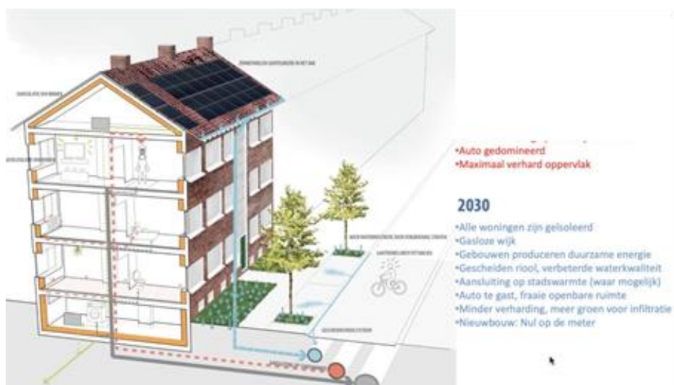
Afbeelding: Overzicht aan opgaven en vraagstukken die spelen met betrekking tot het toekomstbestendig maken van de wijk

Zoals in de inleiding van deze deelvisie al werd geschetst sloot de kwaliteit en opzet van de wijk al betrekkelijk snel na de oplevering niet meer aan bij de woonbehoeften van veel inwoners en leidde dit, in combinatie met de eenzijdige opzet van de wijk, tot serieuze problemen op het gebied van leefbaarheid. Om de onderliggende problemen aan te pakken wordt al langere tijd ingezet op een transformatie van de wijk, waarbij het vervangen van gestapelde bouw door eengezinswoningen en gebruik maken van de aanwezigheid van de duinen de belangrijkste ingrediënten zijn. In de transformatie van de wijk zijn het Duinpark, het Kreekpark en de tiny houses in de Falgatuinten succesvol gerealiseerde voorbeelden van deze aanpak. Er is nog niet in iedere (woon)buurt gewerkt aan transformatie. Hierdoor kent de wijk nog steeds veel buurten met een (behoorlijk) eenzijdige opzet en woningaanbod.