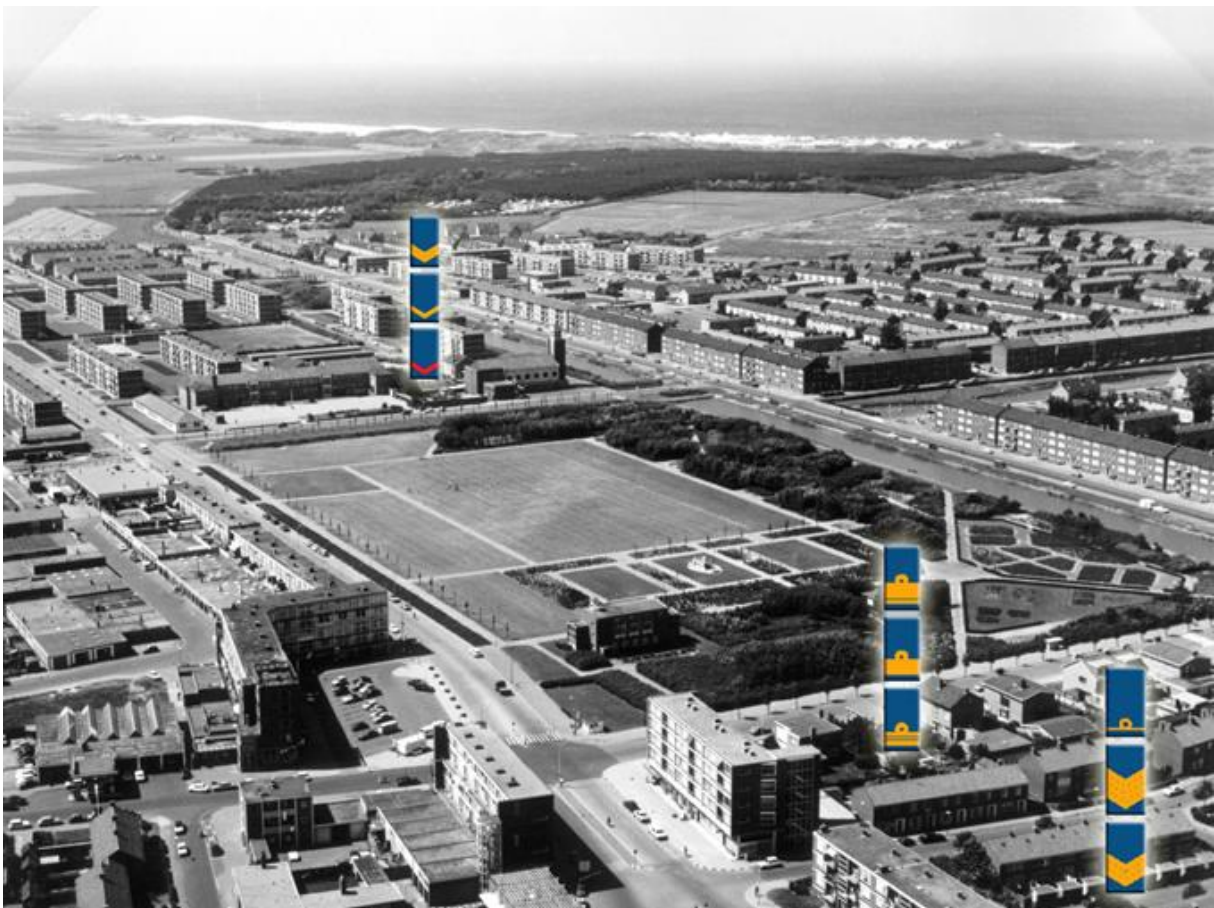
Afbeelding: hiërarchische opbouw van de wijk in de jaren '50, '60 en '70 met verschillende woningtypen bestemd voor verschillende rangen binnen de Koninklijke Marine

De bouw begon in de jaren '50 met de buurt Jeruzalem, zo genoemd in verband met de witte kleur van de betonnen woningen. Na het gedeelte ten westen van de Jan Verfaillweg gerealiseerd te hebben werd in hoog tempo verder gebouwd aan de oostzijde van de Jan Verfaillweg. Kenmerkend aan de wijk is dat de opzet het hiërarchische karakter van het Den Helder van die tijd weerspiegelt, door de dominante positie van de Koninklijke Marine als werkgever. Portiek- en galerijflats waren bestemd voor matrozen en lagere onderofficieren, eengezinswoningen voor hogere onderofficieren en betere eengezinswoningen voor de hogere officieren. Hiermee ontstond een bepaalde segregatie tussen buurten, ondanks dat de wijk als geheel behoorlijk gemengd was. De grote scheidingswegen tussen de buurten versterkten dit effect nog extra.