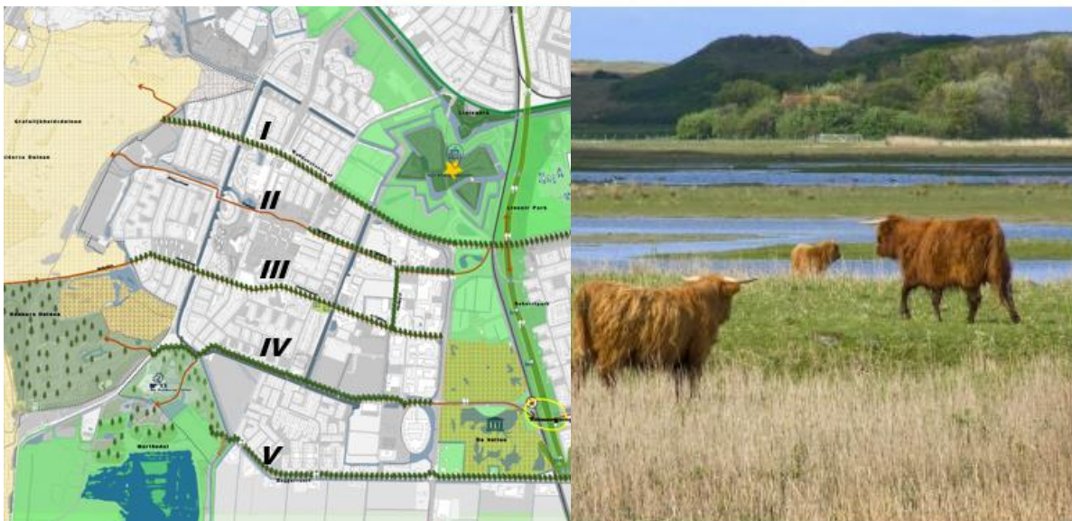
Afbeeldingen: Door de wijk lopen vijf oost-west verbindingen (links) naar het duingebied (rechts)

Naast het toegankelijker maken van de overgangsgebieden tussen wijk en duingebied zetten we in op het doortrekken van het duinlandschap de wijk in. In flinke delen van de wijk is het duinlandschap niet of nauwelijks zichtbaar en voelbaar, terwijl dit grote kansen biedt voor de kwaliteit en de aantrekkingskracht van de wijk. Daarom zetten we erop in om Nieuw Den Helder verder te ontwikkelen tot een wijk die overduidelijk in de duinen ligt. Hierbij focussen we met name op de westrand van de wijk, waar de afstand tot het duingebied klein is en een goede overgang tussen wijk en duingebied goede verbindingen voor de hele wijk oplevert. Door de wijk lopen vijf grote oost-west verbindingen die uitkomen in het duingebied. Langs deze verbindingen zetten we in om het (binnen)duingebied meer de wijk in te laten lopen, door middel van de inrichting van de openbare ruimte en architectuur en materiaalgebruik van gebouwen.