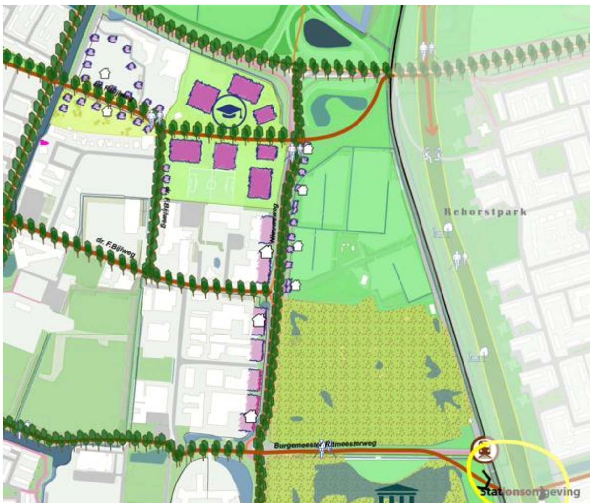
Afbeelding: Impressie van mogelijkheden transformatie Bijlweggebied, versterking entree Nieuw Den Helder via de Nieuweweg en afwaardering van de fly over bij de Waddenzeestraat.

In de rand van het schootsveld van Fort Dirksz Admiraal, tussen de Waddenzeestraat en de Texelstroomlaan, wijzen we een zoekgebied voor ontwikkeling na 2030 aan. Een aantrekkelijke ontwikkeling op deze locatie biedt aanvullende kansen om Nieuw Den Helder meer te verbinden met De Stelling en meer functies toe te voegen langs verbindingssassen tussen de verschillende wijken (Texelstroomlaan en Waddenzeestraat). Een eventuele ontwikkeling dient goed ingepast te worden in de landschappelijke en cultuurhistorische structuur van De Stelling.