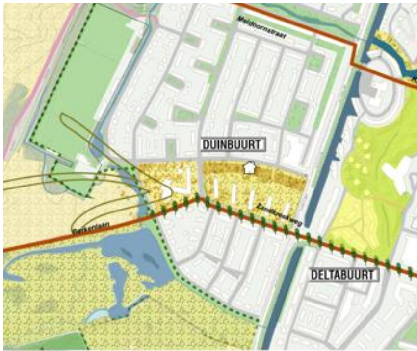
Afbeelding: Impressie van het doortrekken van het duinlandschap langs de Duinroosstraat.

De openbare ruimte tussen de Duinroosstraat/Berkenlaan en de Elzenstraat biedt veel kansen om het duinlandschap verder de wijk in te krijgen. Door de opzet van dit deel van de wijk lopen er veel minder noord-zuid verbindingen dan ten noorden en ten zuiden van dit gebied. Bovendien zorgt de huidige gestapelde bouw voor een grotere hoeveelheid openbare ruimte en langere zichtlijnen. We zoeken mogelijkheden om het duinlandschap zichtbaarder te maken in de openbare ruimte van het gebied en zetten in op een aantrekkelijke verbinding naar het duingebied. Bij toekomstige aanpassingen/transformatie van de opzet van het gebied houden we rekening met deze ambitie en zetten we in op verdere versterking van de landschappelijke verbinding.