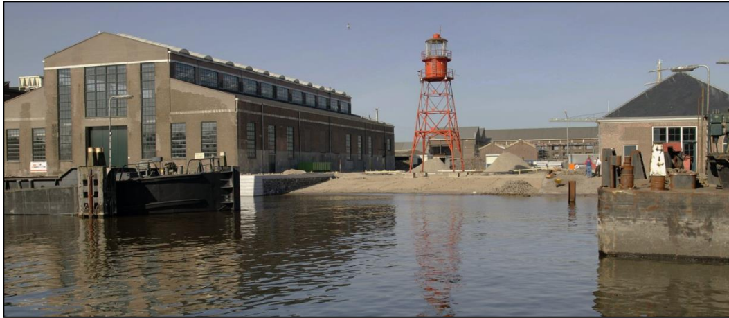
Figuur 5 / Aanleg van de hellingbaan in 2003

Vanaf 1995 kwam een deel van de voormalige marinewerf in handen van de gemeente en werd er begonnen met restauratiewerkzaamheden van diverse gebouwen. In 2003 werd de openbare ruimte bij de projectlocatie onder handen genomen en werd er bij gebouw 66 een hellingbaan aangelegd waar later een loopbrug overheen is komen te liggen (figuur 5).