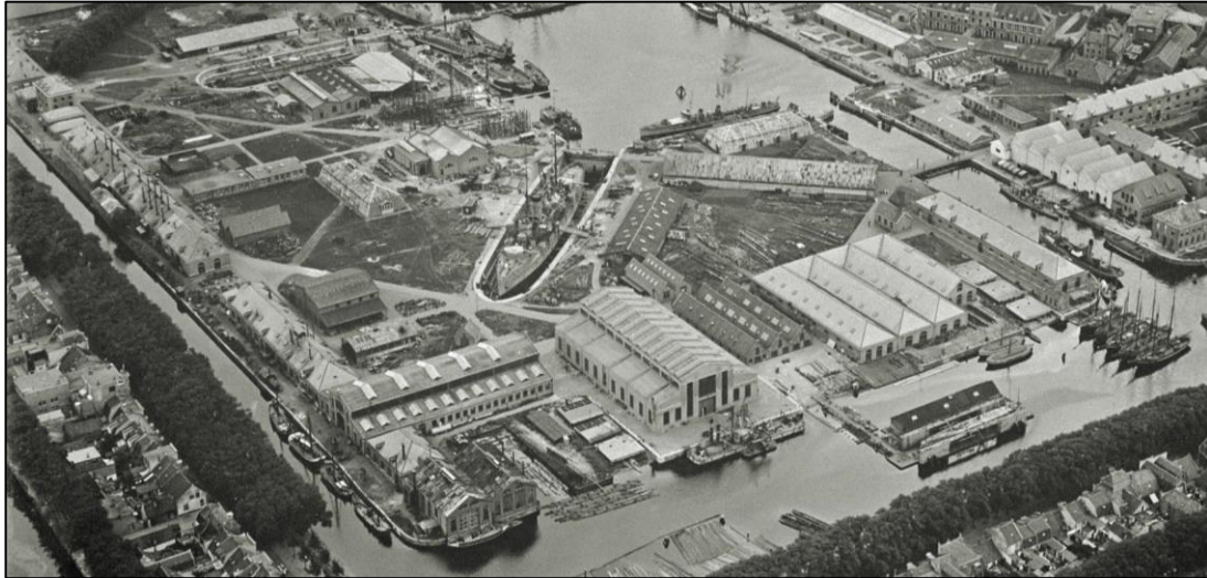
Figuur 3 | Luchtfoto Willemsoord 1924

Door het beëindigen van de mastenproductie verloren ook de hellingbanen hun functie. In foto's uit de jaren '80 is te zien dat de hellingbanen zijn vervangen door een kade. Slechts een kort gedeelte van de voormalige hellingbaan ligt er, maar is begroeid met planten (figuur 4). Het feit dat een gedeelte is vervangen door een kade en een deel begroeid is, toont aan dat de hellingbanen niet meer in gebruik waren en dus geen functie hadden.