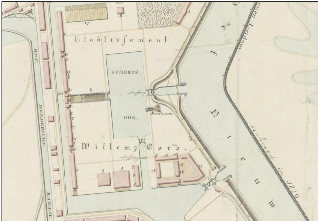
Figuur 2 | Willemsoord 1833

De projectlocatie ligt aan de zuidzijde van de historische Rijkswerf Willemsoord, dit gedeelte is opgericht aan het begin van de 19 e eeuw. In de plattegrond van 1833 is de eerste bebouwing op Willemsoord te zien, evenals de hellingbanen (figuur 2). Het huidige gebouw 66 is zichtbaar in de kaart en deed, samen met het naastgelegen pand, dienst als mastenloods (gebouwen nummer 4 op de kaart).