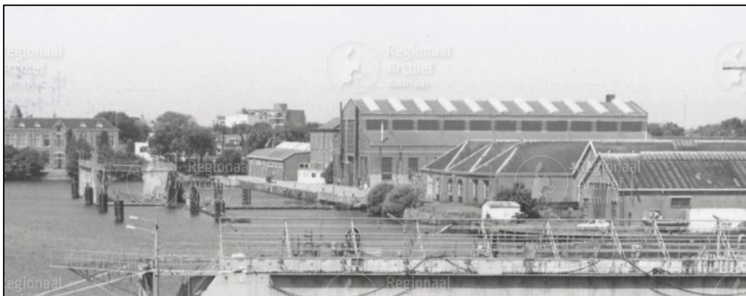
Figuur 4 | Foto's Willemsoord jaren '80