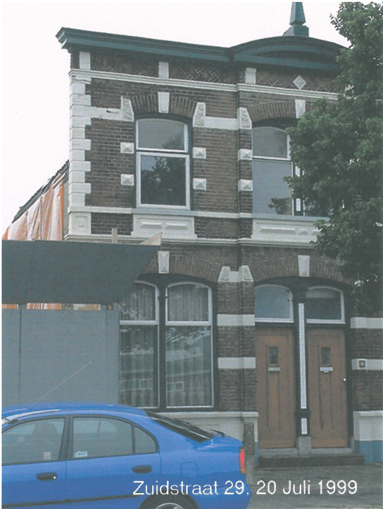
Zuidstraat 29, 20 Juli 1999