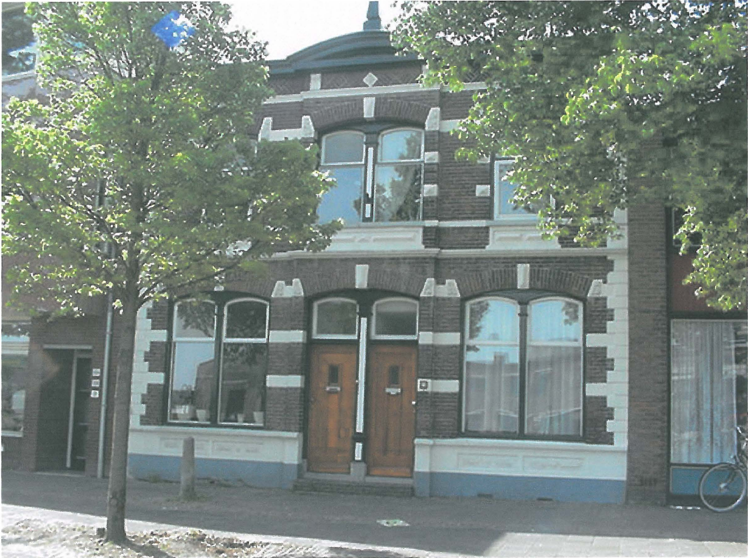
Zuidstraat 28 - 29 juni 2001