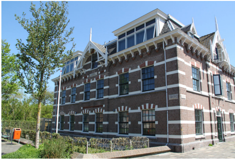
Jacob van Heemskerckstraat 1, huidige situatie Beeld: Atelier Rietmeijer ARCHitecten BNA