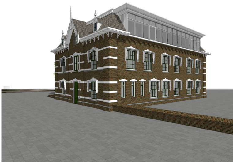
Jacob van Heemskerckstraat 1, toekomstig beeld, rechterzijde. Beeld: Atelier Rietmeijer ARCHitecten BNA