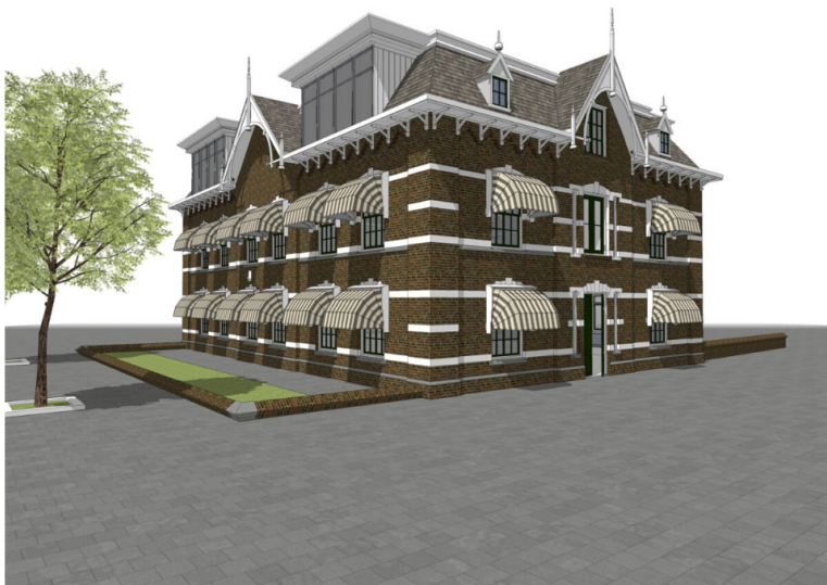
Jacob van Heemskerckstraat 1, toekomstig beeld met markiezen. Beeld: Atelier Rietmeijer ARCHitecten BNA