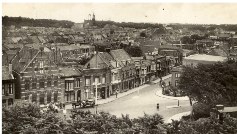
Koningstraat (Stadshart cluster A). Beeld: Braaksmas & Roos Architecten