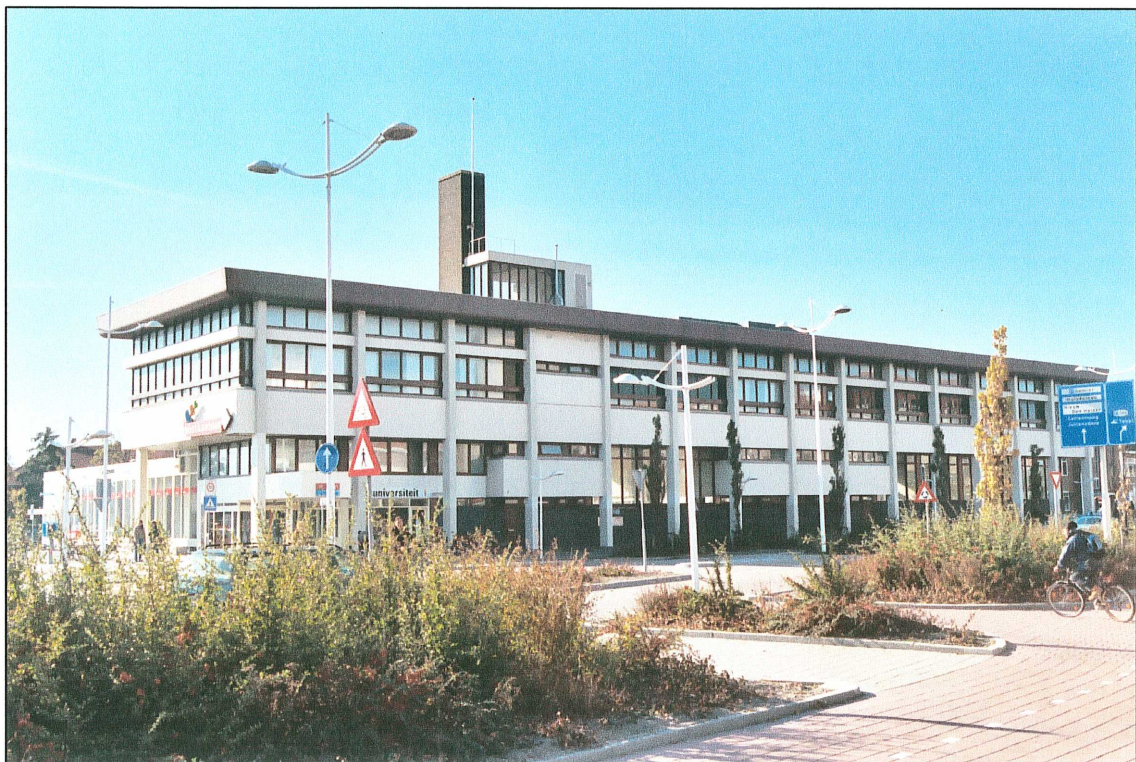
Afb. 1: De locatie van het postcomplex.