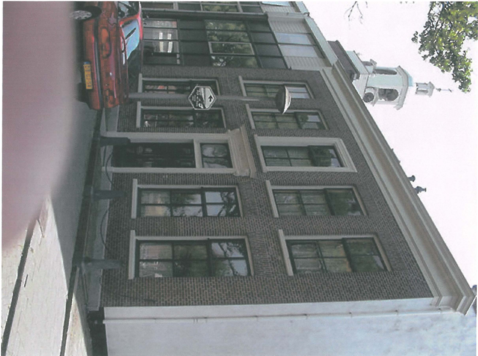
Kerkgracht 50 juni 2001