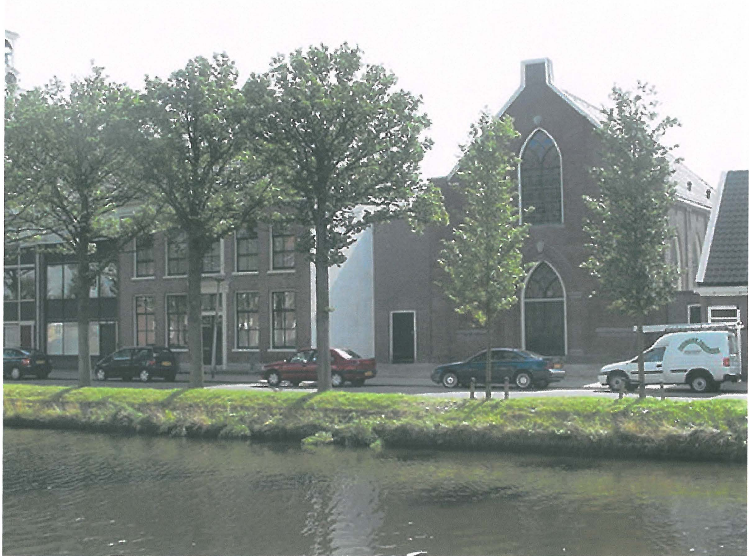
Kerkgracht 49 kerk september 2001